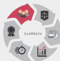
Qualidade nos Processos