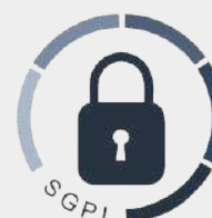
Lei Geral de Proteção de Dados